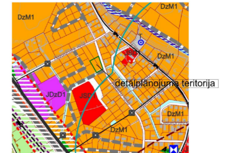
Teritorijas novietojuma shēma